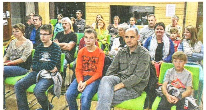
Les enfants ont fait preuve d'une attention particulière.

Elle ralentit alors énormément sa physiologie, ramenant les